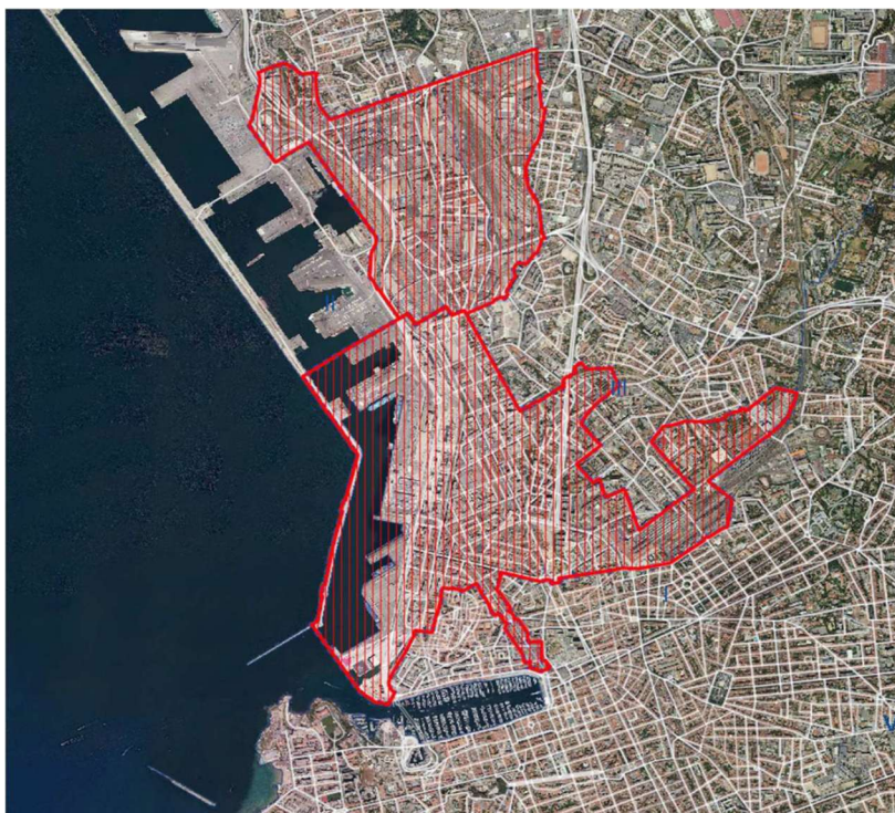
Périmètres Euromed 1 (au Sud) et Euromed 2 (au Nord)